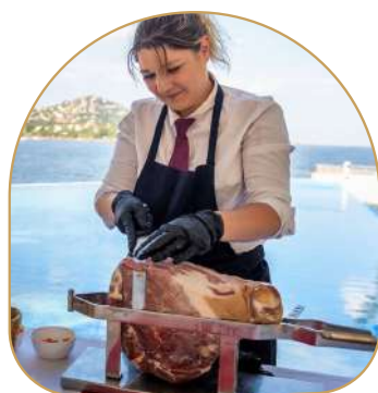
Découpe de jambon Ibérique