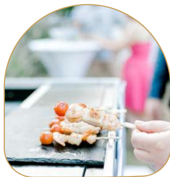
Brochette de Gambas & Saint-Jacques au vinaigre balsamique ✂