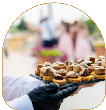
Foie gras poêlé sur pain d'épices & gelée d'hibiscus ♥

4 animations au choix pour un vin d'honneur d'exception