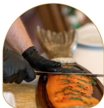
Découpe de saumon Gravlax sur son pain de seigle ♥