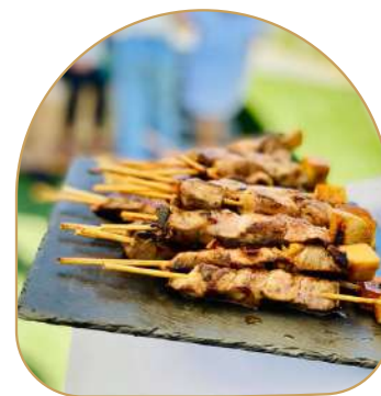
Brochette de Canard & ses pommes glacées au miel de Provence ♥