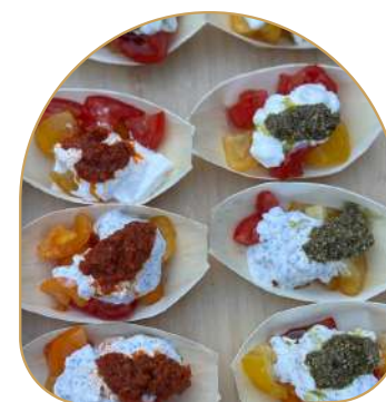
Atelier Burrata ♥

D'autres options disponibles sur demande.