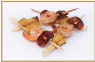
Brochettes ananas, gambas, chorizo 🌾