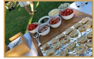
Atelier bruschettas ♥ 🌱