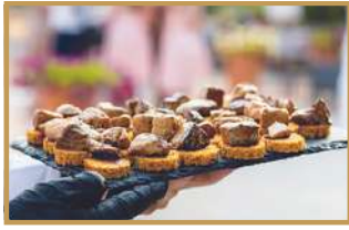
Foie gras poêlé sur pain d'épices & gelée d'hibiscus ♥