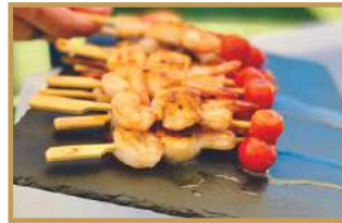
Plancha gambas/St Jacques au vinaigre balsamique 🌾