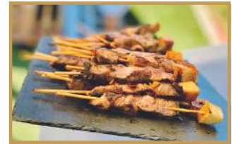
Brochettes de canard & ses pommes glacées au miel 🌾