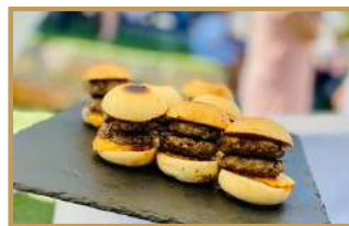
Mini burgers (au choix) ; ♥ - hamburger à l'américaine - foie gras - des Iles (banane plantain) - à la Française (façon Rossini)