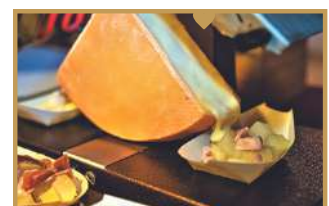
Atelier Raclette 🌾