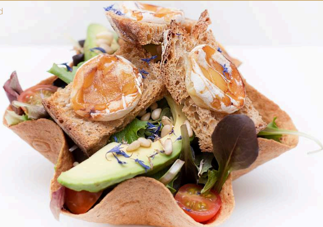
Salade chèvre chaud