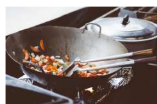
Wok de légumes