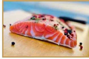
Saumon Gravlax sur pain de seigle (à partie de 80 pax)