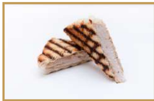
Madame croque Monsieur (poulet, porc ou végétarien)