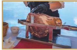
Découpe de jambon Ibérique (à partie de 80 pax)